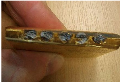
Rajah 1: Jongkong emas 100g yang mengandungi tungsten

Jadual 1 menunjukkan projek-projek penyelidikan yang lepas mengenai pengukuran ketulenan emas menggunakan kaedah ujian tanpa musnah. Tujuan utama projek penyelidikan ini adalah untuk mendedahkan emas palsu dalam perdagangan emas. XRF dan ultrasonik yang digunakan untuk menentukan ketulenan emas mempunyai keterbatasan. XRF hanya dapat meneliti sampel emas sekitar kedalaman 10 hingga 50 mikron daripada permukaan sample (Corti, 2001). Keterbatasan teknik ultrasonik pula adalah ianya tidak mampu untuk mengukur ketulenan emas yang saiznya lebih kecil daripada probe ultrasonik yang digunakan. Kraut dan Stern (2000) mendakwa bahawa pengukuran ketumpatan emas mudah untuk aloi binari seperti emas-perak atau emas-tembaga. Ianya mudah disebabkan oleh ketumpatan emas berkadar terus dengan ketulenan emas pada aloi binary tersebut. Sekiranya ketumpatan emas aloi tersebut tinggi, maka ketulenan emas juga tinggi. Oleh itu, sepatutnya aloi binari untuk tungsten-emas juga mudah diukur.