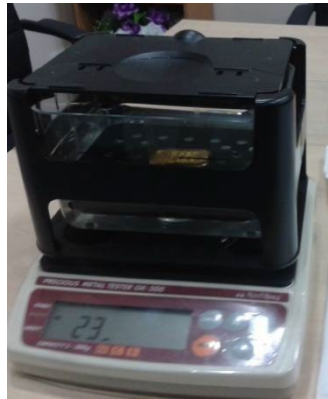
Rajah 2: Densimeter digunakan untuk mengukur ketulenan emas

al., 2011). Alat timbangan dan densimeter adalah antara instrumen yang boleh dipercayai untuk menentukan ketulenan emas menggunakan kaedah penimbangan hidrostatik (Mercer, 1992). Rajah 2 dan Rajah 3 masing-masing menunjukkan pengukuran ketulenan emas menggunakan densimeter dan alat timbangan.