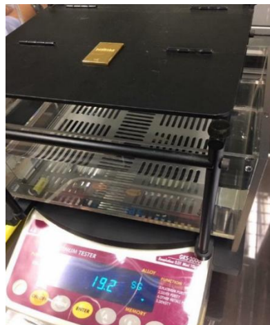
Rajah 7: Tentukuran densimeter dengan menggunakan piawaian emas

Piawaian emas digunakan sebagai standard rujukan untuk tentukuran densimeter dan alat timbangan. Oleh itu, semua instrumen pengukuran ketulenannya dapat dikesan ke unit SI dan nilai pengukurannya lebih tepat dan seragam apalagi untuk mengelakkan kesilapan semasa pengukuran. Selanjutnya, perdagangan emas akan meningkat dan keyakinan pengguna dapat dipertingkatkan. Rajah 7 menunjukkan tentukuran densimeter pelanggan menggunakan piawaian emas.