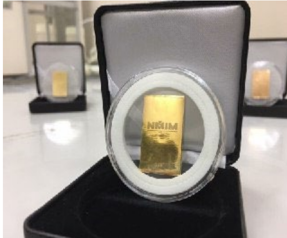
Rajah 6: Piawaian emas Malaysia

Piawaian emas digunakan sebagai standard rujukan untuk tentukuran densimeter dan alat timbangan. Oleh itu, semua instrumen pengukuran ketulenannya dapat dikesan ke unit SI dan nilai pengukurannya lebih tepat dan seragam apalagi untuk mengelakkan kesilapan semasa pengukuran. Selanjutnya, perdagangan emas akan meningkat dan keyakinan pengguna dapat dipertingkatkan. Rajah 7 menunjukkan tentukuran densimeter pelanggan menggunakan piawaian emas.