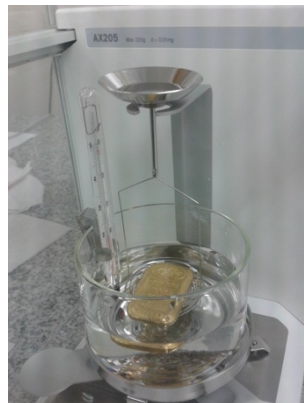
Rajah 3: Alat timbangan berat digunakan di makmal ujian dan analisis.

Ketumpatan emas yang diperolehi seperti dalam Jadual 2 diukur menggunakan alat timbangan (Pengeluar:Mettler Toledo) di mana sampel emas yang digunakan adalah dari 8 karat hingga 24 karat (E.Mercer, 1992). Dalam kajiannya mendapati bahawa mereka tidak dapat mengesan emas yang disalut dengan bahan lain terutamanya jika bahan tersebut mempunyai ketumpatan yang hampir sama dengan emas.