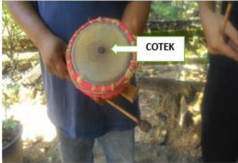
Gambar 8: Cotek