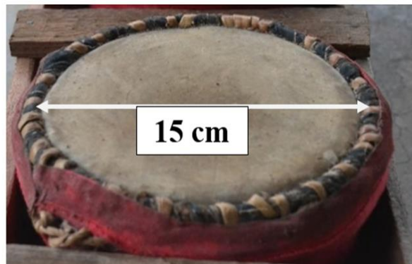
Gambar 5: Ukuran Permukaan Rebana