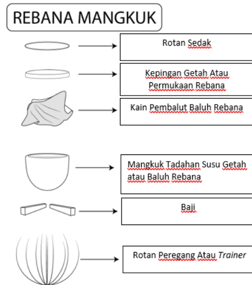
Gambar 2: komponen-komponen asas rebana mangkuk

yang ditegang dari tepi permukaan ke bawah mangkuk lalu ia diketatkan dengan menggunakan kayu baji (Lihat Gambar 2). Manakala dari segi bunyi yang dihasilkan daripada paluan Rebana Mangkuk ini juga hampir sama dengan bunyi paluan kertuk dan paluan rebana dikir.