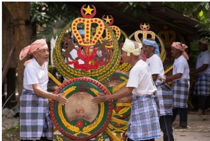
Gambar 1: Rebana Ubi

Hasil dari pemerhatian kajian lapangan yang dilakukan Rebana Mangkuk ini dikategorikan di dalam kumpulan alat muzik satu muka iaitu memberanofon. Hal ini kerana sumber bunyi yang terhasil dari Rebana Mangkuk adalah melalui getaran dari kepingan getah sekerap yang dijadikan permukaan Rebana Mangkuk. Walaupun pengkaji tidak berpeluang melihat cara pembuatan Rebana Mangkuk disebabkan oleh faktor usia pengasasnya iaitu En Yusof, namun pengkaji dapat merakam butir-butir perbualan dengan beliau dan para penggiat yang lain mengenai proses pembuatan dan bahan yang digunakan. Asasnya bentuk Rebana Mangkuk adalah seperti mangkuk yang besar seakan-akan baluh rebana. Bentuknya terbahagi kepada dua bahagian iaitu bahagian badan dan bahagian permukaan Rebana Mangkuk. Dari segi asasnya pula rebana mangkuk seakan-akan Rebana Ubi namun ianya mempunyai saiz yang agak kecil dan mempunyai bilangan kayu baji yang sedikit berbanding Rebana Ubi (Lihat Gambar 1). Namun Rebana Mangkuk pula hanya mempunyai dua batang kayu yang diikat di bawah Tapak Rebana Mangkuk dan dijadikan tempat untuk meregangkan getah di permukaan rebana.