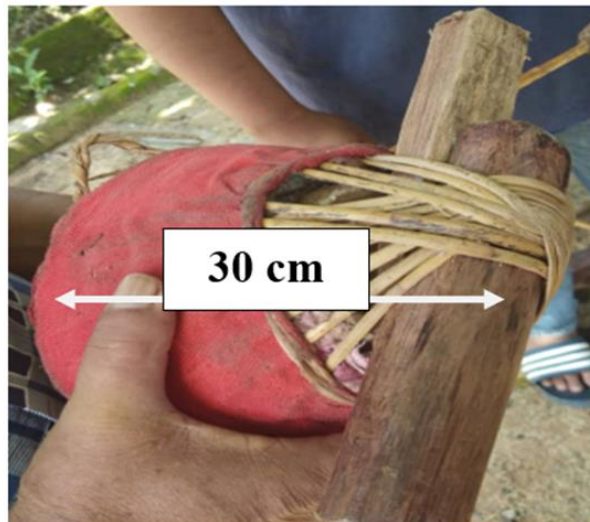
Gambar 6 : Ukuran Ketinggian Rebana