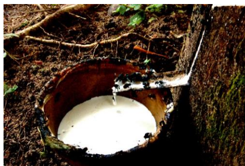
Gambar 3 : Getah Sekerap Dan Cawan Tadahan

Menurut Encik Zakaria salah seorang penggiat seni persembahan tradisional Rebana Mangkuk mengatakan bahawa bunyi Rebana Mangkuk sedikit berbeza dengan Rebana Dikir ataupun dengan Rebana – Rebana lain kerana bunyi yang dihasilkan oleh Rebana Mangkuk lebih nyaring dan tidak begitu kuat kerana saiz Rebana Mangkuk lebih kecil jika dibandingkan dengan Rebana-Rebana lain. Berdasarkan penerangan yang dibuat oleh Encik Yusof untuk membuat sesebuah Rebana Mangkuk tidak semudah yang disangka kerana kebiasaannya untuk mendapatkan cawan tadahan susu getah (Lihat Gambar 3) agak sukar kerana faktor harga dan permintaan yang amat tinggi.